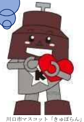
川口市マスコット「きゅほりん」