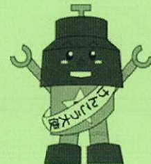
川口市マスコット きゅぼらん