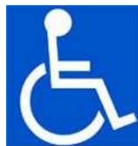
国際シンボルマーク