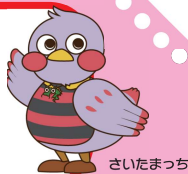
さいたまっちゃん

医療機関への受診の際など様々な生活場面で、障害の特性を理解し、円滑に支援していただくためのものです。各市町村障害福祉担当窓口などで配布しています。