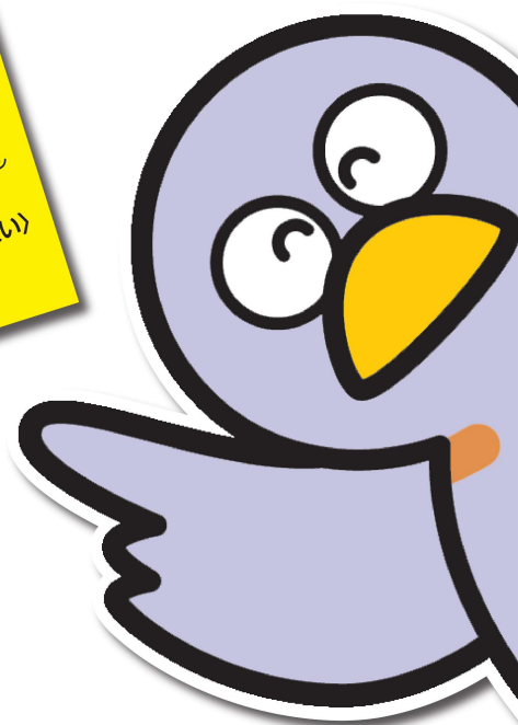
埼玉県のマスコット「コバトン」