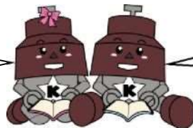
川口市マスコット 「ぎゅぼらん」