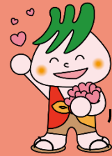
川口市社協マスコット社助