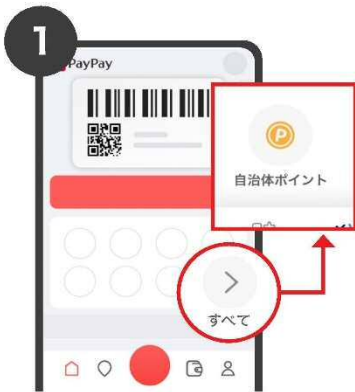
1 アプリトップから「>」 「自治体ポイント」を選択