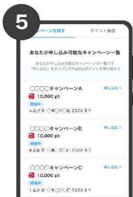
5 申し込み可能なキャンペーン を確認(申し込み可能な キャンペーンがない場合は 表示されません)