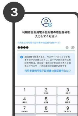
3 マイナンバーカード受け 取り時に設定した4桁の 暗証番号を入力