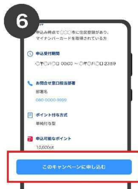
6 内容を確認の上「このキャン ペーンを申し込む」を選択