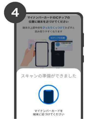
4 マイナンバーカードの上 にスマートフォンを乗せ スキャンを実施