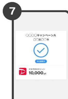
7 自治体マイナポイントへの 申し込みが完了 付与予定のポイントを確認