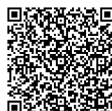
ホームページ QRコード