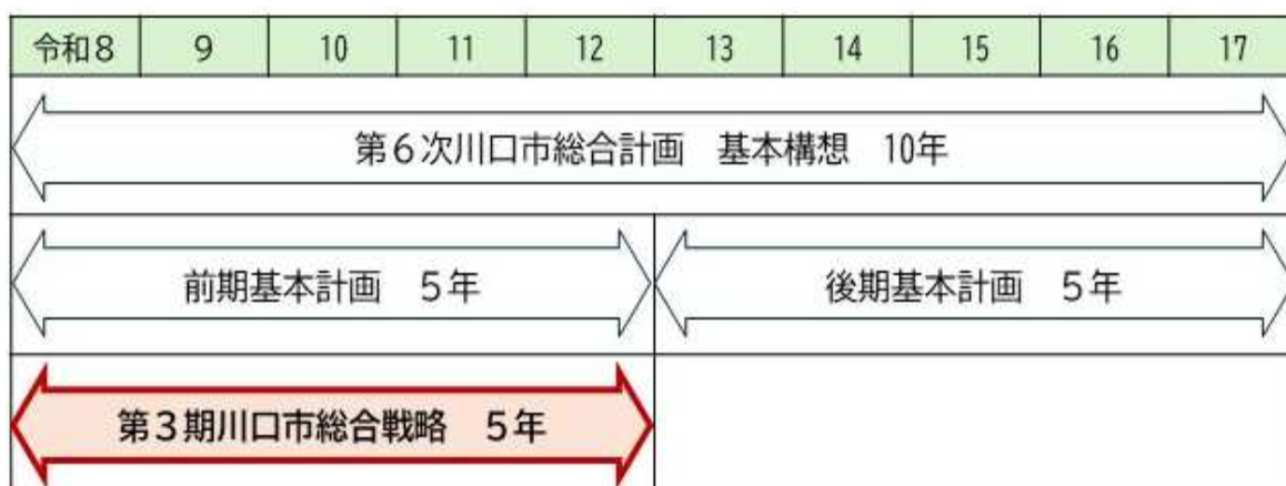
第3期川口市総合戦略の計画期間

また、「第6次川口市総合計画」の計画期間と合わせて策定することにより、本市の最上位計画である総合計画との整合を図り、一体的で効率的・効果的な推進を図ります。