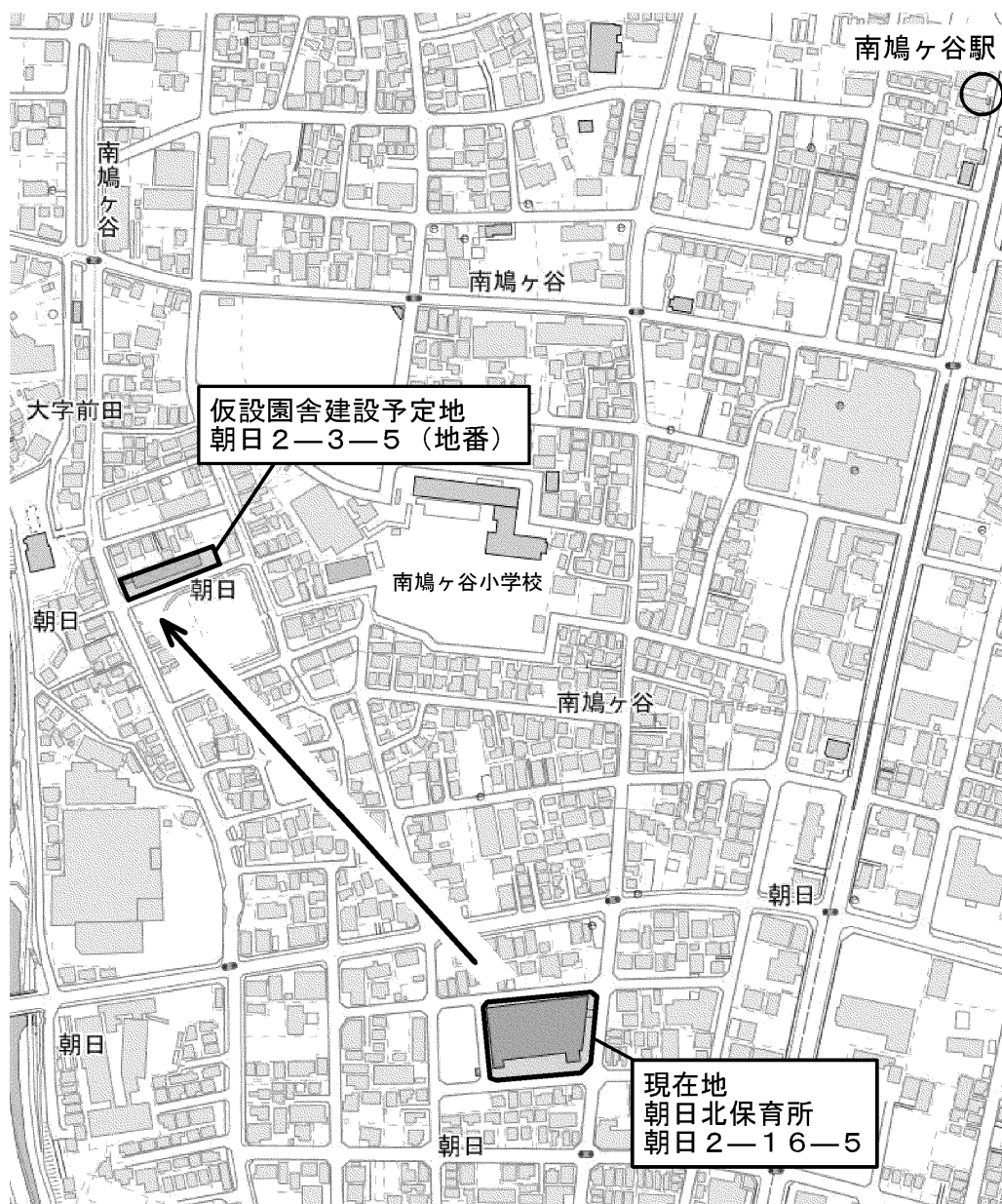
【朝日北保育所仮設園舎建設予定地 位置図】

朝日北保育所は併設している朝日町市街地施設付住宅が借地契約期間満了により今後廃止となるため、朝日2丁目の敷地（朝日2-3-5（地番））に仮設園舎を建設し、一時移転を予定しております。仮設園舎への移転時期は、令和6年度中（令和7年3月末ごろ）を予定しています。