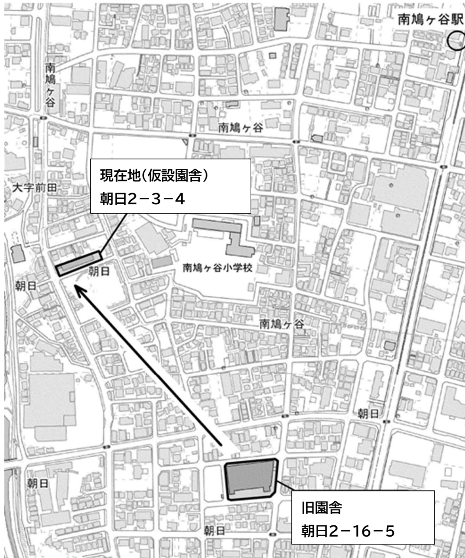
【朝日北保育所所在地(仮設園舎) 位置図】

朝日北保育所は、新園舎建て替えのため、仮設園舎(住所:朝日2-3-4)に一時移転しています。