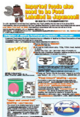
食品表示制度の案内リーフレット（英語、中国語）