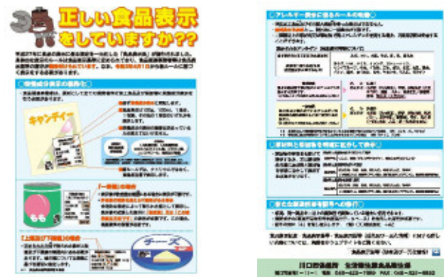
食品表示制度の案内リーフレット

令和2年4月1日から、食品表示法に基づく食品表示基準が完全施行されました。市内で製造・販売・流通する食品について、窓口対応等の機会や監視指導の際に、食品を安全に摂取するために重要なアレルゲン等の事項を中心に、適正表示がされるように指導します。特に、本市においては外国人が経営する店舗が数多くあるため、理解の助けとなるように、翻訳したリーフレット等の資料を活用しての重点的な監視指導を行います。