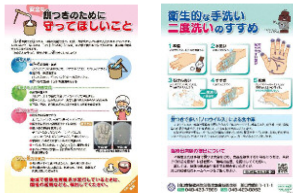
「安全な餅つきのために守ってほしいこと」リーフレット

縁日、祭礼、文化祭など地域振興のイベントで食品の提供を行う模擬店の出店を予定している主催者や市民に対し、大量調理の注意事項や提供に適した食品、検便の指導や調理者の体調管理方法等について講習会を実施します。特に、町会・自治会等の主催で開催されることが多い夏祭りや餅つき大会などの開催前には、町会・自治会回覧やホームページ等で食中毒予防の普及啓発を行うとともに、要望に応じて積極的に出前講座等を行います。また、イベント開催時には関係部局と連携し、情報共有を図り食中毒予防の普及啓発に努めます。