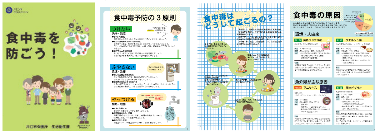
「食中毒を防ごう！」リーフレット

また、家庭における食中毒の発生を防止するため、市民向けのリーフレット等の普及啓発資材や動画を利用し、関係部局と連携して周知します。