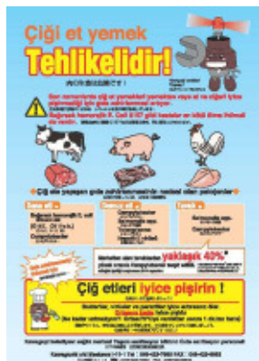
食肉による食中毒防止啓発リーフレット（トルコ語、ベトナム語）

そこで、多言語に翻訳した食品衛生に関するリーフレットを活用するとともに、廃棄物処理を所管する環境部や下水道を所管する上下水道局と合同で、駅周辺の飲食店等約400施設を目標に一斉パトロールを行います。