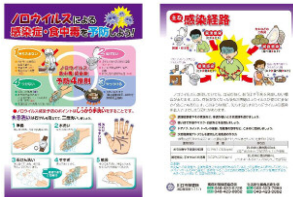
ノロウイルス食中毒防止啓発リーフレット

また、消費者については、食事前やトイレ後などの手洗いの励行やノロウイルスによる感染を広げないための家庭でできるノロウイルス消毒方法を講習会や啓発資料等を活用して普及啓発を行います。