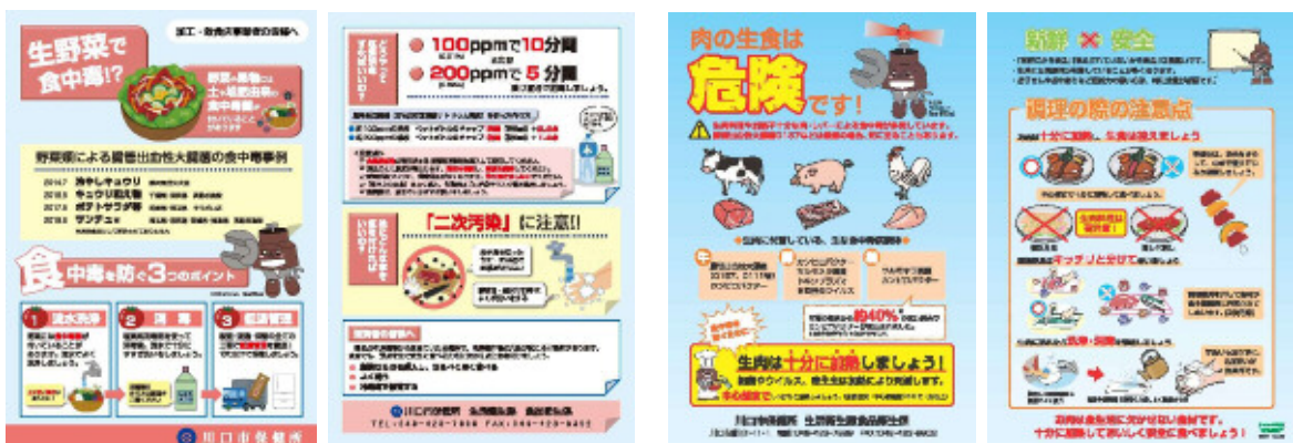
生野菜による食中毒防止啓発リーフレット

カンピロバクター* 及び腸管出血性大腸菌* による食中毒の原因の多くは、生又は加熱不十分の食肉の喫食や、調理過程での生肉等の不適切な取扱いによる二次汚染に起因していることから、生肉の取扱い状況について重点的に監視指導を行います。特に、居酒屋、焼肉店、焼き鳥屋等の飲食店については、法令で禁止されている牛肝臓及び豚肉の生食用としての提供がないこと等、規格基準の遵守の徹底を図るとともに、生肉を調理する際は、中心部まで十分な加熱調理を行うよう指導します。