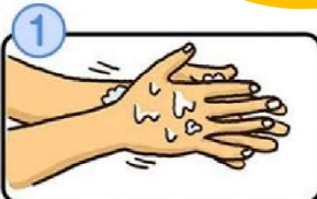
流水でよく手をぬらした後、石けんをつけ、手のひらをよくこすります。