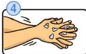
指の間を洗います。