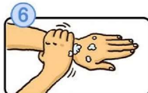
手首も忘れずに洗います。

Sai khi rửa bằng xà phòng xong, rửa sạch bằng nước chảy và dùng khăn tay sạch hoặc khăn giấy để lau tay rồi làm khô tay.