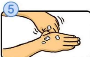
親指と手のひらをねじり洗いします。