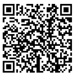
青木保健ステーション 地図