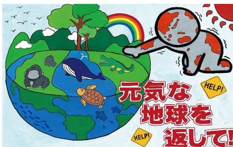
中学生の部 最優秀賞