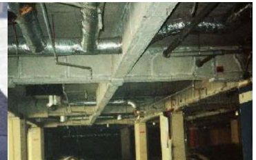
鉄骨を被覆して保護 石綿含有耐火被覆材