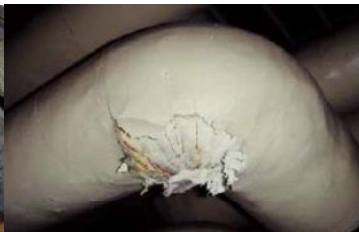
エルボ部に使用 石綿含有保温材