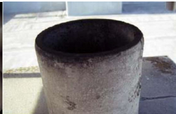
煙突の内側に使用 石綿含有断熱材