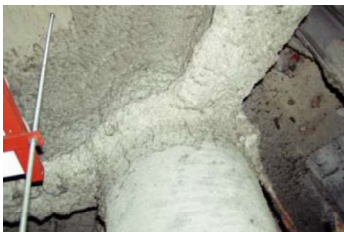
柱や梁に施工 吹付け石綿