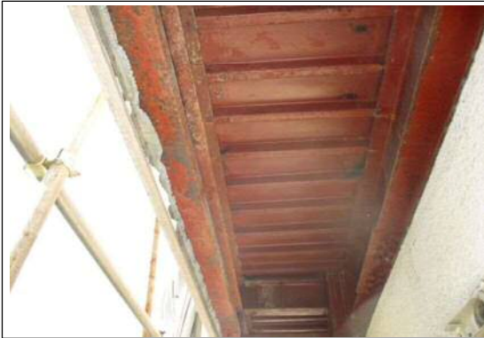
石綿除去細部の状況1 (写真⑤)