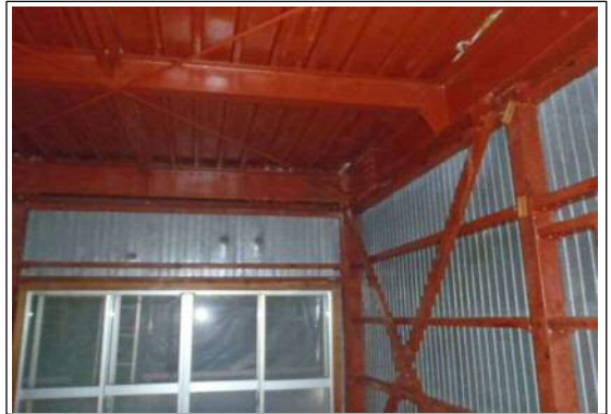
石綿除去細部の状況2 (写真⑥)