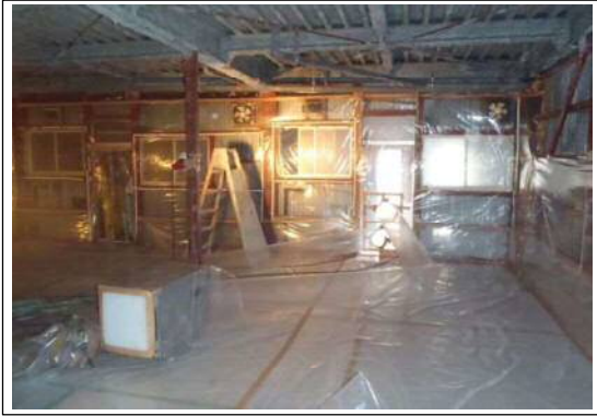
撤去前の状況全景1 (写真①)