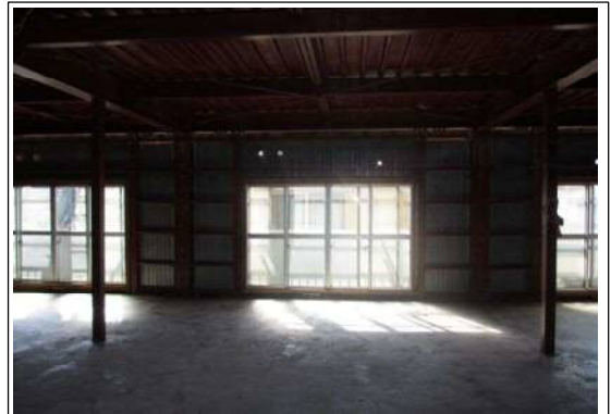
撤去後の状況全景2 (写真④)