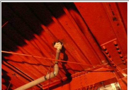
石綿除去細部の状況3 (写真⑦)