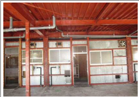
撤去後の状況全景1 (写真③)