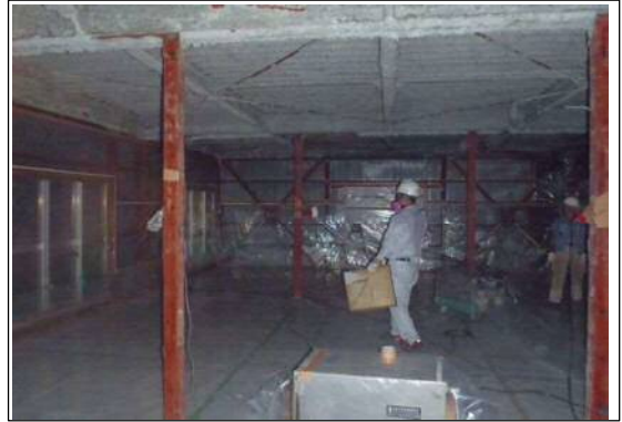
撤去前の状況全景2 (写真②)