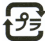
プラスチック製容器包装 (上記のマークのあるもの)