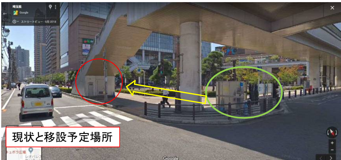
現状と移設予定場所