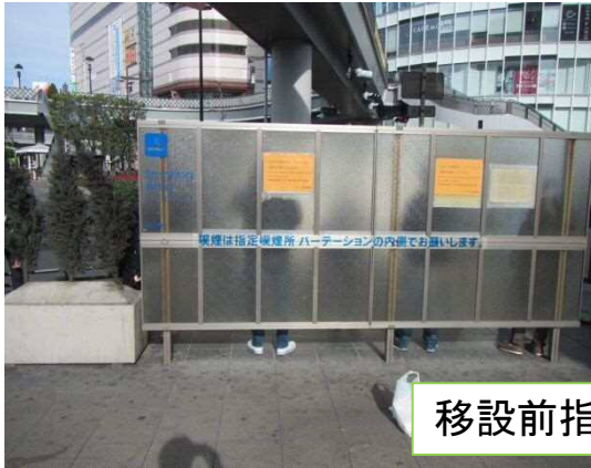
移設前指定喫煙所