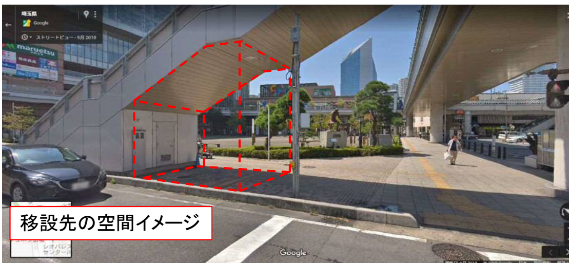
移設先の空間イメージ