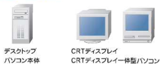
デスクトップ パソコン本体