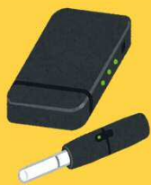
加熱式・電子タバコ