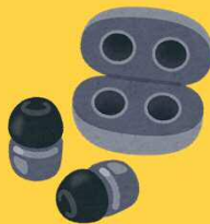
ワイヤレスイヤホン